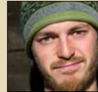
Fotoreise mit Marc Graf