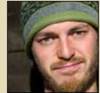
Fotoreise mit Marc Graf