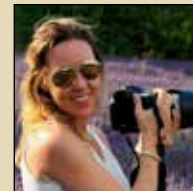
Fotoreise mit Nicola Lederer