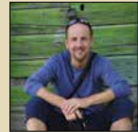
Fotoreise mit Franz Gerdl