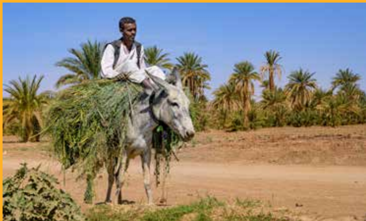
Foto-Rundreise Sudan zu nubischen Dörfern und Schwarzen Pharaonen

Die landschaftliche Schönheit des Niltals und der angrenzenden Wüsten, die außergewöhnlichen archäologischen Zeugnisse und die Freundlichkeit der Sudanesen sind der Grund, dass wir 2019 erstmals eine Foto-Rundreise in den Sudan durchführt haben.