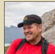
Fotoreise mit Rainer Skrovny